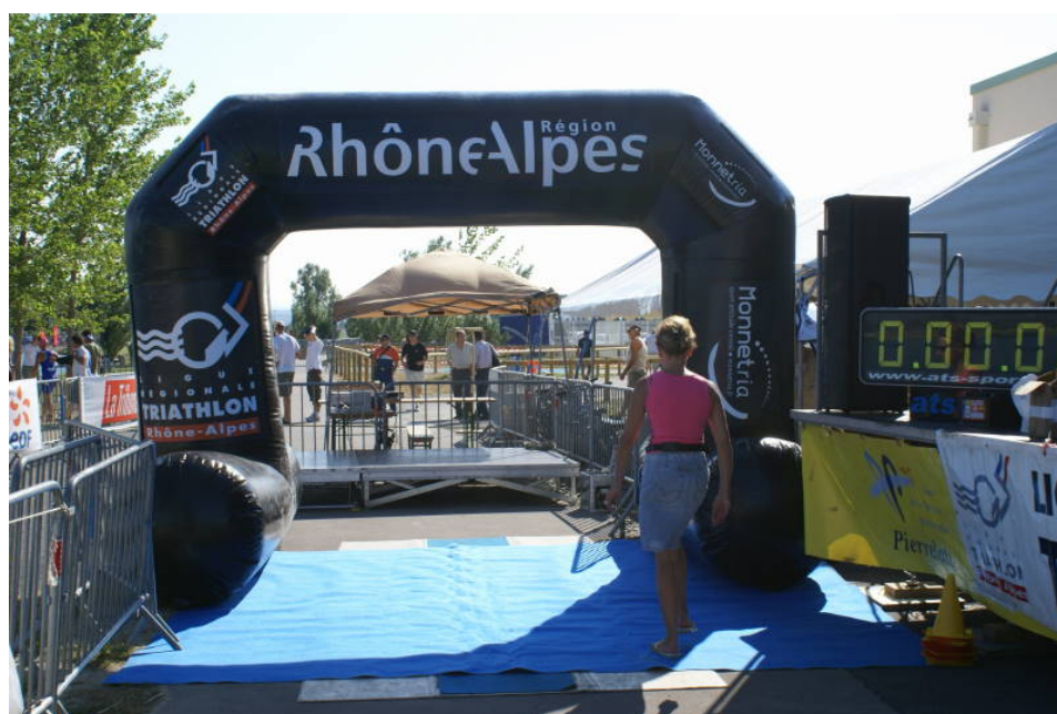
Photo : Pierrelatte – Championnat de France Jeunes de Triathlon 2010